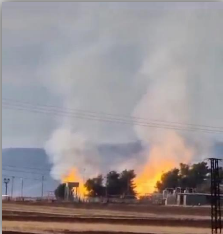
محطة الكهرباء في مدينة عامودا

- استهداف محطة كهرباء عامودا التي يتم من خلالها تغذية محطة الدباسية و ابار محطة علوك بالتيار الكهربائي