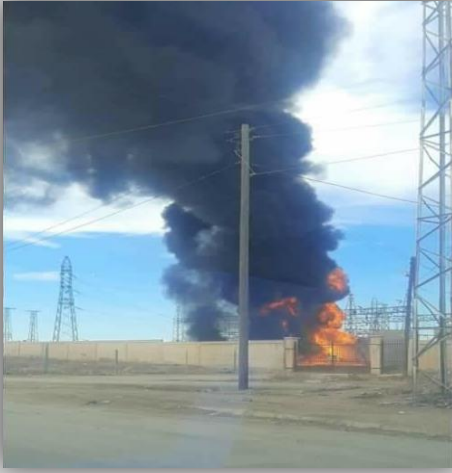
محطة الكهرباء في مدينة قامشلو

- استهداف دراجة نارية على الطريق الدولي في قرية خراب عشك جنوب شرق مدينة كوباني 45كم.