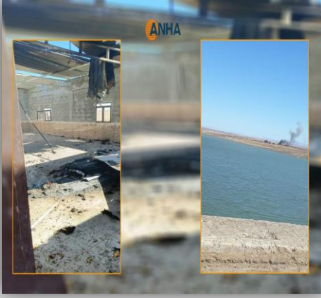
استهداف سد جل آغا/الجوادية

- في 05.10.2023، شنت طائرات تركية غارات جوية على موقع محطة عودا النفطية في بلدة ترسبيه/القحطانية التابعة لمقاطعة قامشلو. وقد أدى القصف إلى اندلاع حرائق في المحطة وتدمير بعض المعدات والخزانات. ولم ترد أنباء عن وقوع ضحايا بشرية حتى الآن. وتعتبر محطة عودا النفطية أحد أهم مصادر الطاقة في المنطقة، وتوفر الوقود للمدن والقرى المجاورة.