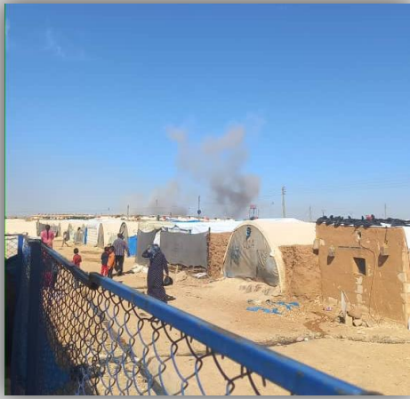
مخيم واشوكاني للنزحين في الحسكة