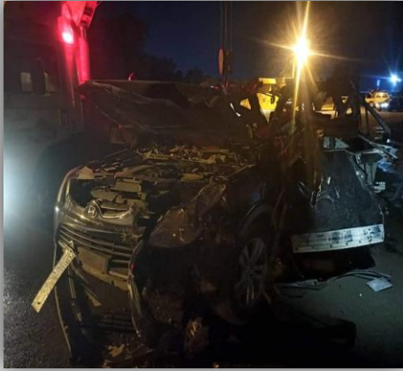
استهداف سيارة مدنية في الحسكة

- استهداف محيط محطة تحويل المياه في قرية الركبة على طريق الحسكة جنوبي مدينة تل تمر، ما أسفر عن وقوع اضرار مادية.