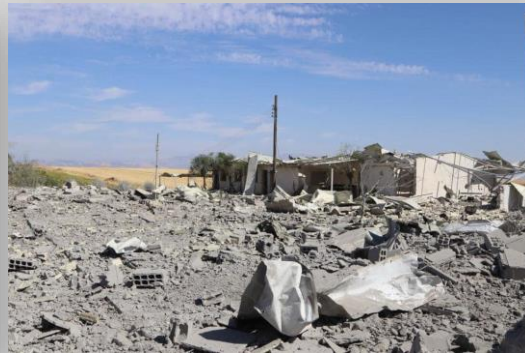
مشفى كورونا في قرية كري فرا/مدينة ديرك