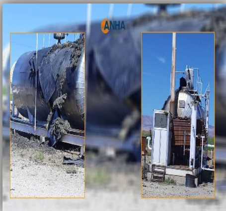
محطة سعيدة النفطية ترسبيه/القحطانية

- استهداف ورشة لتصليح سيارات في قرية "قصف" جنوب غربي ناحية صرين التابعة لمقاطعة كوباني بثلاثة قذائف