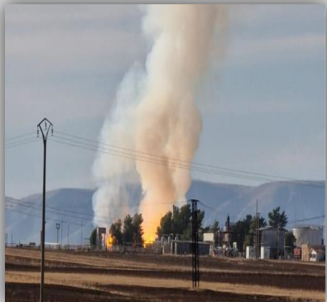
محطة عودا النفطية في ترسببيه/القحطانية