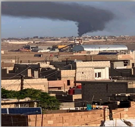
استهداف محطة كهرباء في عامودا

- أفادت مصادر محلية أن سد جل آغا/الجوادية في مدينة الحسكة تعرض لهجوم بطائرة مسيرة تركية مساء يوم الخميس 05.10.2023. وقالت المصادر إن الهجوم ألحق أضراراً مادية بالسد وبعض المنشآت المجاورة له. وأضافت المصادر أن السد يزود مناطق واسعة من الحسكة بالمياه والكهرباء، وأن الهجوم يهدف إلى تقويض الاستقرار والأمن في المنطقة..