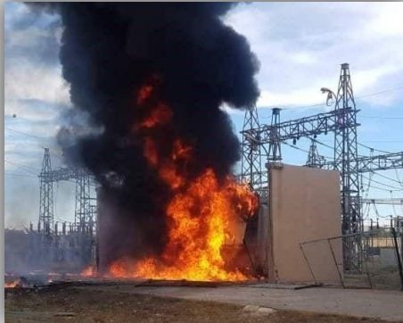
محطة الكهرباء في سويدية/ ديرك

- استهداف البنية التحتية ل جبل عبد العزيز\كزوان في مدينة الحسكة أسفر عن اضرار مادية.